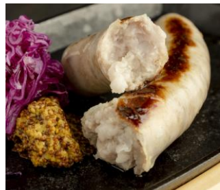
〈ブラートヴルスト〉